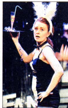
...det är frågan som Subfrau besvarar på Södra teatern.