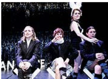
Subfrau turnerar just nu i Norden med sin nya föreställning The Subfrau acts .

Se videoscener ur The Subfrau Acts inklusive intervjuer med skådespelarna