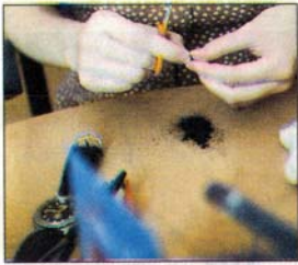
Skagg på strå. Ett lager klisters under hakan och en hög med skaggstrån ger Tony rätta stubben.