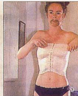
3. KORSETTEN. Vad vore en riktig karl utan denna?